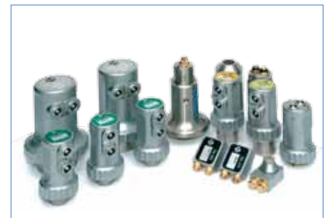
Compatibilité avec un grand choix de sondes