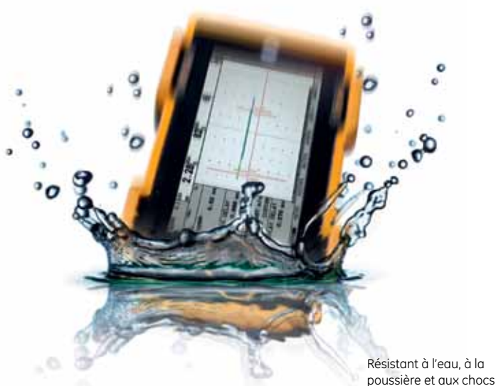
Résistant à l'eau, à la poussière et aux chocs